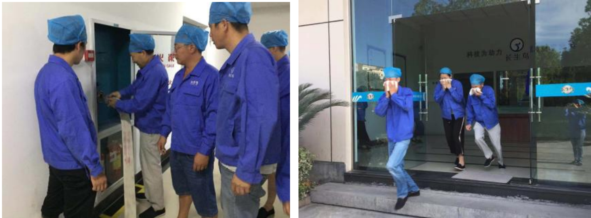
图 6.3-01 2018 年火灾应急演练记录

案》等应急预案、《触电事件应急预案》、《重大设备故障应急预案》等应急处置方案等，对火灾、机械、触电等均有相应的应急措施，并成立了应急指挥中心和应急救援专业组。