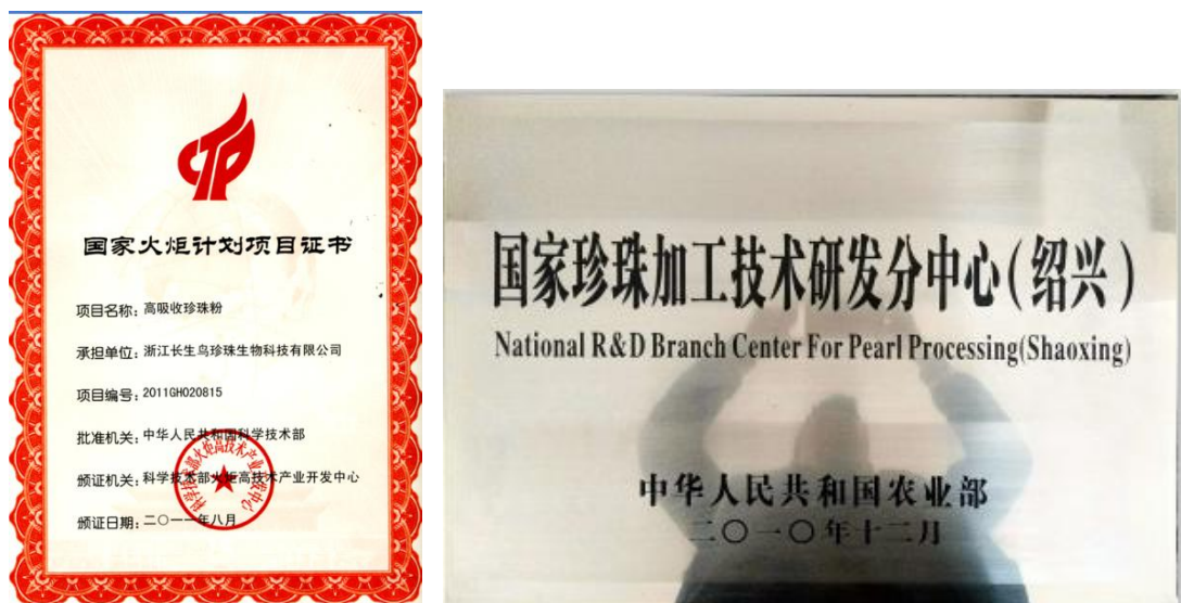
图 3.3-1 社会认可的证书（示例）

公司恪守商业道德，坚持诚信经营和公平竞争原则。公司从多年的经营实践中总结提炼的价值观就是“开拓创新、追求卓越、诚恳守信，共同发展”，并以此为准绳奉行不止，高层领导带头学习《公司法》、《产品质量法》、《环境保护法》、《劳动法》等法律法规培养对客户讲诚信，重合同，守信用；对社会讲诚信，守公德，行公益的行为准则。公司每年销售交易额翻倍增长，公司从不违约，也从不因为价格、质量、交货期、收付款等问题与客商发生过纠纷，深受国内外客户的信赖。为此，公司先后获得政府、客户颁发的“诚信守法示范企业”、“浙江名牌产品”等荣誉，如图 3.3-1 所示：