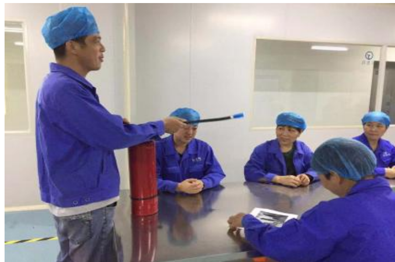
图 3.2-1 公司安全培训活动

公司将员工学习和发展视为“投资”，把创建学习型组织，营造全员学习的氛围作为公司长期发展战略的重要组成部分。随着公司规模扩大和全球化发展战略的实施，根据企业相关规定及各部门要求确定培训人员的需求情况。各部门负责人确定人员培训需求后经公司领导审批，相关部门每季度根据人员数量酌情进行培训计划的制定与实施。公司并成立了“长生鸟商学院”，见图 3.2-1 所示。